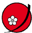
Aikido Shinki Rengo