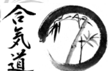
1. Aikido Club Düsseldorf e. V.

Haftung: Teilnehmer trainieren auf eigene Gefahr. Die Teilnehmer tragen selbst Sorge, dass ihrerseits keine Bedenken bestehen, eine sportliche Betätigung auszuüben und sie den „Aikidō-Bewegungsanforderungen“ entsprechen.